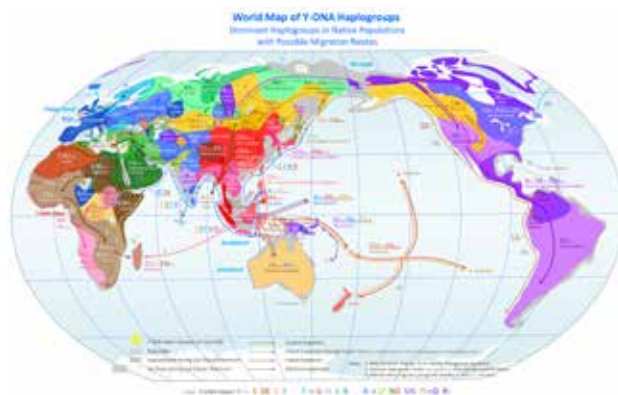
Haploskupiny ve světě

oblíbená společnost MyHeritage či FamilyTreeDNA za přijatelnou cenu (v akci cca 800-1300 Kč). Ve vytvořeném profilu je následně možné najít a kontaktovat řádově tisíce více i méně příbuzných, často z USA, kde se nacházejí potomci dávno zapomenutých sourozenců našich předků, kteří odešli hledat štěstí za oceán.