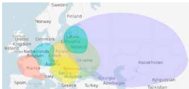
Etnicity na MyHeritage

To mě přivedlo k tzv. genetické genealogii , což je obor kombinující klasickou genealogii vycházející z písemných pramenů s metodami moderní genetiky. Díky testování DNA je dnes možné zcela jednoznačně určit otcovskou linii (člověk-otec-otec otce...) i mateřskou linii (člověk-matka-matka matky...) vedoucí až do pravěku. Mimo to je možné testovat tzv. autozomální DNA, která dohledá příbuzné úplně ze všech větví. Tento test je dnes nejběžnější a nabízí jej např.