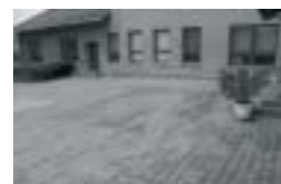
Obec Kameničná Poskytnutá dotace: 800 000,-