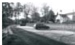
Obec Lukavice Poskytnutá dotace: 590 777,-