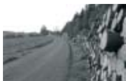
Obec Studené Poskytnutá dotace: 520 813,-

Jak už bylo uvedeno v úvodu, bylo v letošním roce v regionu Orlicko zrealizováno celkem 15 projektů – seznamte se s nimi: