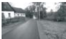
Město Králíky Poskytnutá dotace: 700 000,-