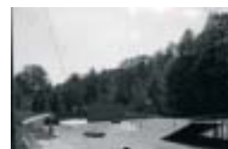
Obec Klášterec nad Orlicí Poskytnutá dotace: 408 402,-