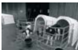
ZESPO CZ s.r.o. Poskytnutá dotace: 175 000,-