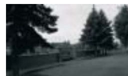
Obec Helvíkovice Poskytnutá dotace: 843 089,-