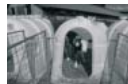
Kunvaldská a.s. Poskytnutá dotace: 350 000,-