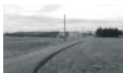
Obec Pastviny Poskytnutá dotace: 692 958,-