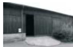
Pavel Kaplan Poskytnutá dotace: 143 065,-