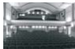
Město Žamberk Poskytnutá dotace: 900 000,-