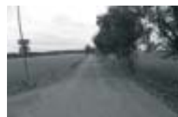
Městys Kunvald Poskytnutá dotace: 698 209,-