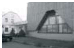
Obec Mistrovice Poskytnutá dotace: 806 391,-