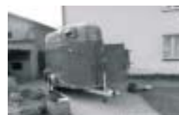
Jezdecký klub Červená Voda Poskytnutá dotace: 360 000,-