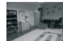
Občanské sdružení CEMA Žamberk Poskytnutá dotace: 491 674,-

V příštím roce se mohou na zkvalitnění zázemí své obce zrealizované s podporou MAS těšit občané města Letohrad a obcí Těchonína, Jamného nad Orlicí, Klášterce nad Orlicí, Dlouhoňovic a Písečné. S novým vybavením a zázemím budou moci svou činnost rozvíjet např. divadelní spolek v Lipce, Raft klub gymnázia v Letohradě, středisko Junáka v Žamberku, tělovýchovná jednota v Dlouhoňovicích, nebo Orel jednota Lukavice.